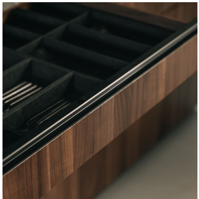
blackline Küche – kubische Formen mit großzügigen Farbglasflächen und präziser Linienführung