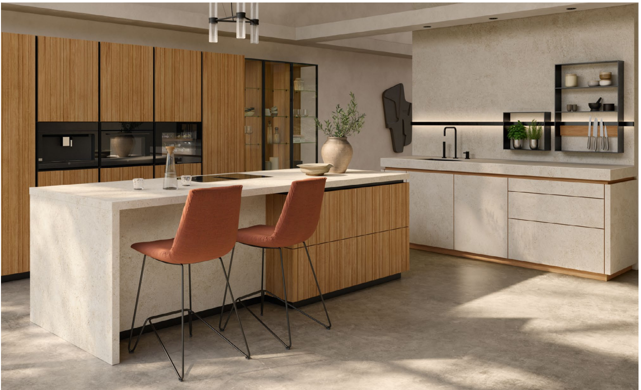
echt.zeit evo Küche – vertikale Fräsungen und durchgängige Frontbilder